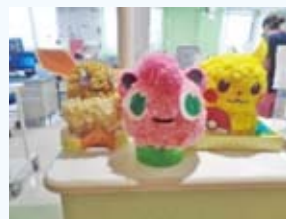
スタッフステーション 前の花紙