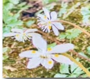
＜五台山の梅花黄蓮＞