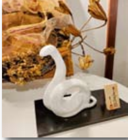
＜軽井沢万台ホテルにて＞

住 所 〒162-0825 東京都新宿区神楽坂4-1-1 オザワビル2F 株式会社ワールドプランニング内 NPO法人日本リハビリテーション看護学会 事務センター 電話番号 03(5206)7431 FAX 03(5206)7757 E-mail jrna@worldpl.jp