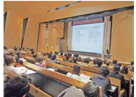
第 31 回学術大会時の大会長講演